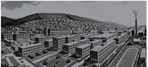
Obrázek: Perspektivní plán Baťových závodů, 1927

18. 10. – 2. podlaží budovy 15, sál B, v 17.00 hod