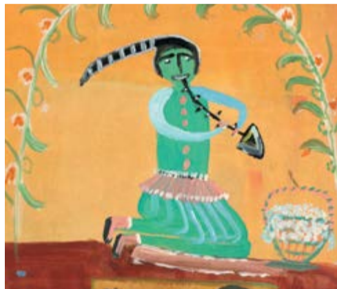
Natálie Schmidová, Zaklínač hadů, 410 x 297 mm, tempera na papíře, kolem 1960, detail