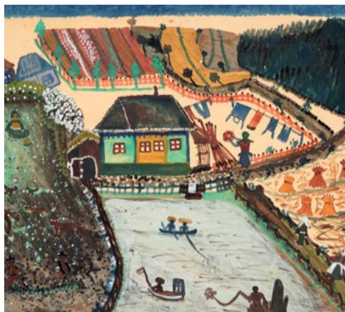
Natálie Schmidtová, Vesnická krajina, 1945, tempera na papíře, Sbirka Národního muzea

Natálie Schmidtová (1895 Dobruška, Rusko – 1981 Rozsochy u Bystřice nad Pernštejnem) je autorkou na pomezí naivního umění a art brut. Obrazy této neškolené umělkyně, pro niž bylo jednodušší malovat než své dílo podepsat, se vyznačují zvláštní citlivostí pro barevné kompozice a schopností vyjádřit radostnou poetiku námětu prostou stylizací předmětů a postav. Svá témata si volila ze vzpomínek na dětství prožité v Rusku, na Sibiři, i snů a představ, které doprovázely její touhu po životě ve vzdálených krajích vysokých hor i rozlehlých rovin, teplých jižních moří i drsného severu. V období druhé světové války se přestěhovala s rodinou do Zlína. Zde, motivována svojí dcerou Miladou Schmidtovou, která sbírala své první umělecké zkušenosti v okruhu žáků a učitelů baťovské školy umění, začala tehdy téměř padesátiletá Natálie malovat. Už její první výstavy uspořádané v roce 1946 v Praze a v Paříži v ní odhalily významnou představitelku světového „primitivního“ umění. Komentovaná prohlídka s kurátorem výstavy Václavem Milkem: 24. 7. v 17.00. hod.