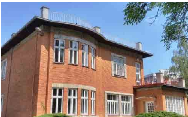
Vila Jana A. Bati (1926-1927), KGVUZ.