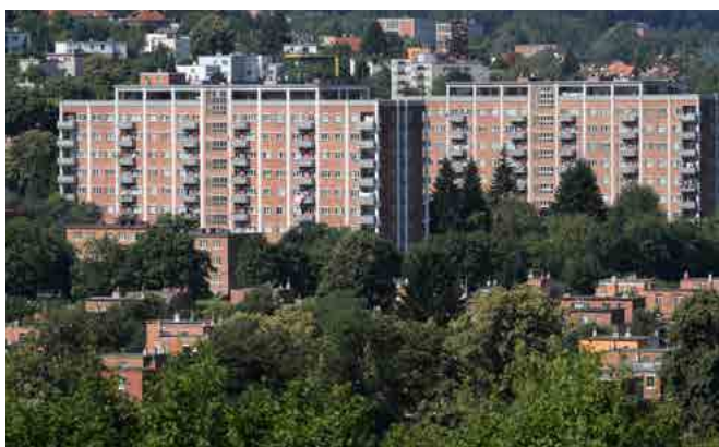
Pohled na Morýsovy domy (1947), KGVUZ. Foto: D. Novotný