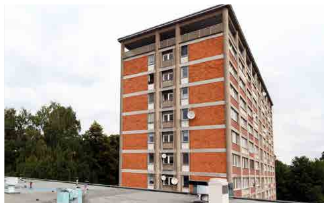
Experimentální dům hotelového typu (1959-1963), KGVUZ.