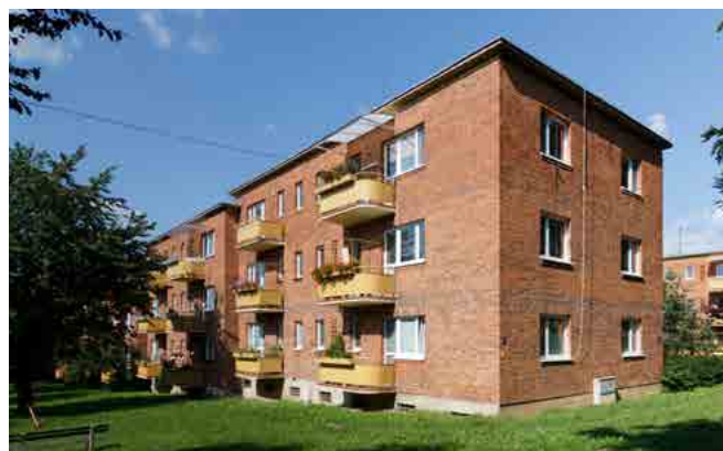
Jeden z činžovních domů, sídliště Obeciny (1947-1949), KGVUZ.