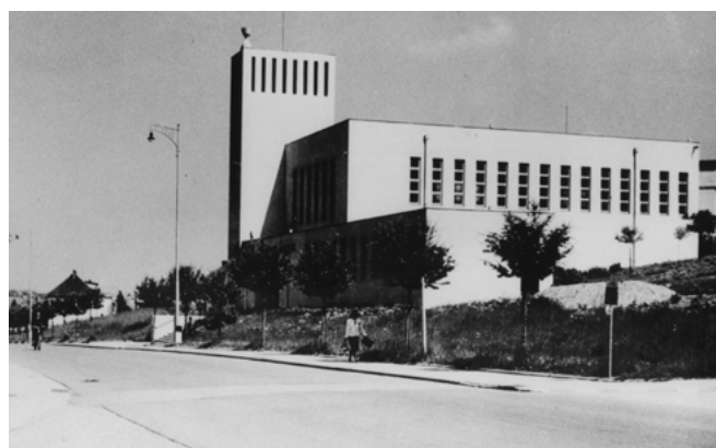
Evangelický kostel (1936-1937)