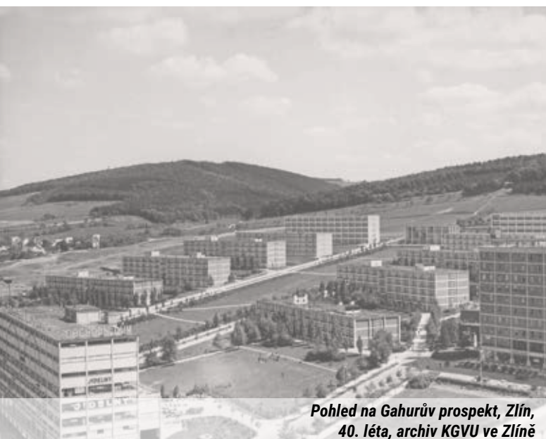
Pohled na Gahurův prospekt, Zlín, 40. léta

1415 BAŤŮV INSTITUT, Vavrečkova 7040, Zlín 760 01