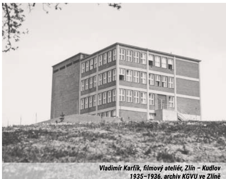
Vladimír Karfík, filmový ateliér, Zlín – Kudlov 1935–1936