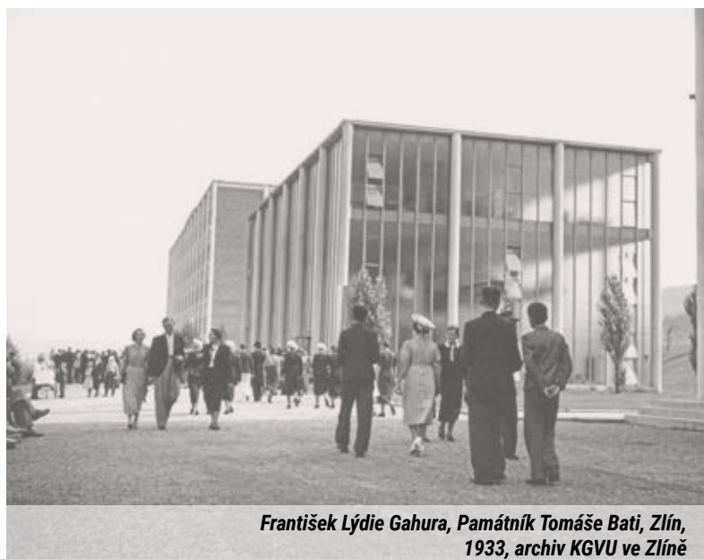
František Lýdie Gahura, Památník Tomáše Bati, Zlín, 1933