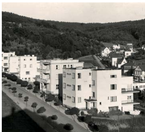
Bohuslav Fuchs, Bílá čtvrť v Luhačovicích 1928–1929, Muzeum města Brna