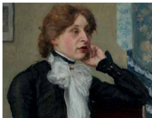
Miloslav Zikmund, Podobizna paní Wenigové, po 1901, olej, plátno, 76 x 63 cm, KGVUZ.

Další ze série výstav zaměřených na přední osobnosti české výtvarné scény přelomu 19. a 20. století představí malíře, literáta a výtvarného kritika Miloše Jiráňka. Výstava prostřednictvím vybraných děl z veřejných a soukromých sbírek přinese široký pohled na Jiráňkovu tvorbu, vedený od počátku činnosti v 90. letech 19. století do závěru předčasně ukončené umělecké i životní cesty v roce 1911. V expozici bude představena autorova invence pozoruhodného rozsahu, která zahrnuje vedle námětů čerpaných ze života moderního města, krajinných motivů a portrétů rovněž folkloristicky zaměřené práce, jejichž inspirační zdroje jsou svázány s oblastí Slovácka. Vernisáž výstavy 19. 2. v 17.00 hod.