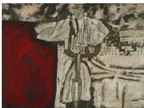
Bedřich Baroš, z cyklu Pláště, 1968, kombinovaná technika, papíř, 85 x 122 cm, KGVUZ

Výstava přibližuje život a malířské dílo Bedřicha Baroše (1936 Tylovice u Rožnova pod Radhoštěm - 1974 Brno), který patří k výrazným představitelům výtvarné scény Zlína šedesátých let 20. století. Přestože se zpočátku věnoval především kariéře hokejového brankáře, v roce 1961 propadl výhradně světu umění. Rané malby robustních, plošně stylizovaných figur vystřídaly před polovinou šedesátých let osobitě kompozice, v nichž se lidské postavy proměnily ve figurální znak vyjevující tíži naší existence. Po srpnových událostech roku 1968 a rozpadu zlínské tvůrčí skupiny 5 & 2, jejímž byl členem, se Baroš propadal stále hlouběji do osobní i tvůrčí krize, kterou ukončila jeho předčasná smrt ve věku třiceti osmi let. Kromě děl ze sbírek veřejných galerií je jeho umělecký odkaz na výstavě zpřístupněn zejména díky cenným zápůjčkám mnoha soukromých majitelů ze Zlína a jeho