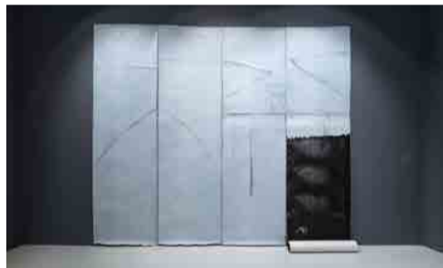
Pohled do výstavy

Opakované pracovní pobyt v prostorách bývalého františkánského kláštera v Hostinném v Podkrkonoší, které tam Adriena Šimotová absolvovala v osmdesátých letech minulého století, představují v rámci její tvůrčí cesty jedinečnou kapitolu. V klášterních celách tehdy pracovala a na neoficiálních výstavách v tamních chodbách a sálech také představovala svoji tehdejší tvorbu. Cyklus Mapování prostoru - Tělo kláštera z roku 1989 je věnován opuštěnému řeholnímu domu v Hostinném - klášterní komunita, která v něm působila, byla v 50. roce násilně rozehnána. Tímto svým výtvarným cyklem frotáží chtěla autorka v naší paměti uchovat duchovní poselství tohoto společenství a poselství tradice, kterou zprostředkovávalo.