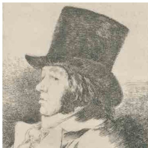
Francisco Goya, Caprichos 1, 1793–1798, vlastní podobizna, NPU, zámek Hradec nad Moravicí