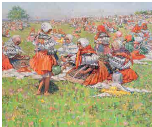
Joža Uprka, Pout' u sv. Antonínka , 1924, 88 x 142 cm, olej, plátno, Galerie Joži Uprky

Komentovaná prohlídka 16. 8. v 17.00 hod.