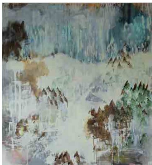
Libuše Dlabola Pražáková, Zima, 2017, akryl na plátně, 115 x 125 cm