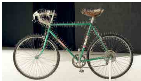
Otis Laubert, Bicykel č. 2, 1992, 115 x 182 x 45 cm