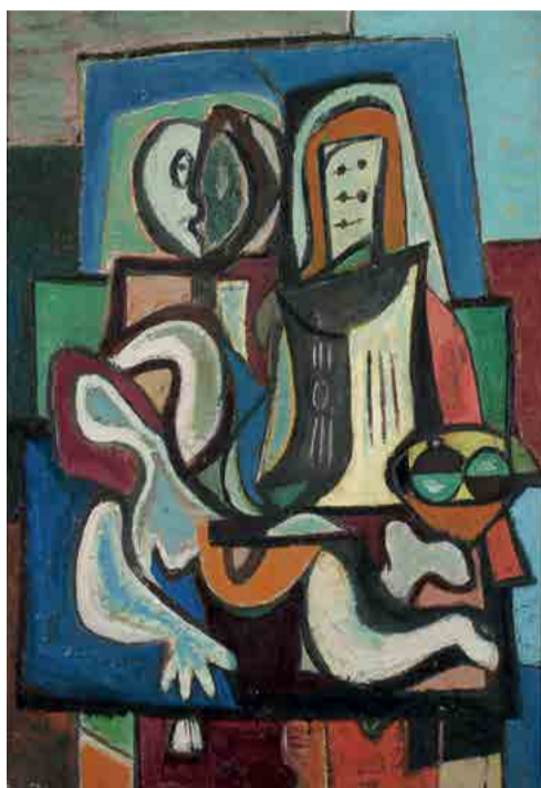
Jakub Bauernfreund, Obraz, kolem roku 1935, olej, plátno, 80,5 x 54,5 cm

do 8. 10. – 2. podlaží budovy 14, grafický kabinet